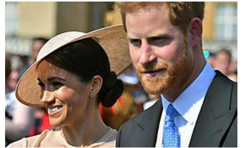
Meghan Markle : sa future vie de duchesse