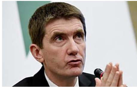
Banlieues : les réactions politiques aux annonces d'Emmanuel Macron