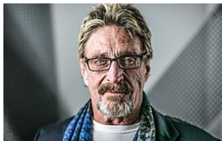
Les « 10 meilleurs » mac antivirus de 2018 (Vous ne devinerez jamais lequel est n°1)